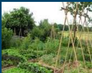
NATURE & ANIMAUX